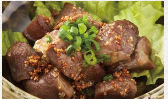
스나즈리 갈릭이타베 750엔 (닭동집 마늘볶음)

국산 닭을 강한 불맛으로 구워냈습니다. 독특한 씹는 맛과 고기의 맛 성분을 즐겨 보세요