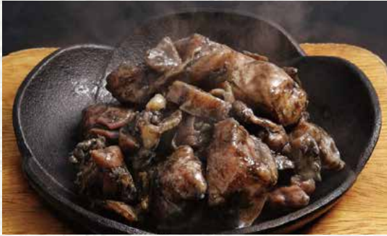
닭다리 아부리 구이 980엔

국산 닭을 강한 불맛으로 구워냈습니다. 독특한 씹는 맛과 고기의 맛 성분을 즐겨 보세요