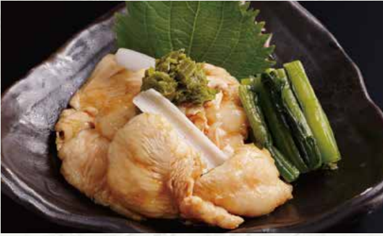
하나미도리 사사미토리와사 580엔 (닭가슴살 와사비)

입에 닿는 느낌이 좋고 살이 부드럽게 만들어진 닭가슴살을 특제 다시간장과 짙은 풍미의 와사비로 드셔보시기 바랍니다. 곁들여 나오는 노자와나즈케(순무잎절임)가 맛의 악센트를 줍니다.