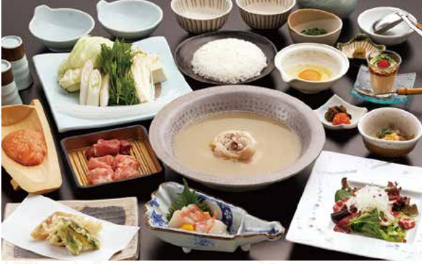
사진은 鳳凰(호우오우) 코스 이미지입니다