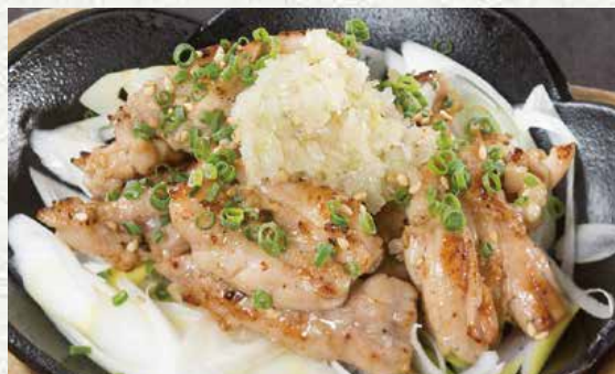
葱盐鸡脖子肉铁板烧 880日元

口感软嫩的鸡胸脯肉，配以特制的海鲜酱油和爽口的青芥末。另配的日式泡菜恰到好处的为您调剂口味。