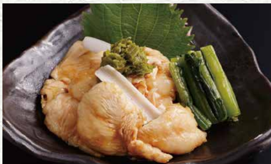
华味鸡青芥末鸡胸脯 580日元

口感软嫩的鸡胸脯肉，配以特制的海鲜酱油和爽口的青芥末。另配的日式泡菜恰到好处的为您调剂口味。