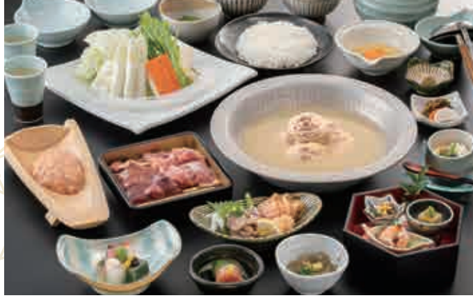
사진은 華 (하나) 코스 이미지입니다