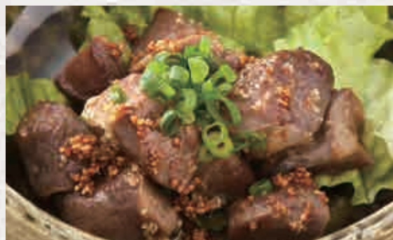
스나즈리 갈릭이타메 550엔 (닭똥집 마늘볶음)

신선한 닭다리살을 먹음직스럽게 구워올린 요리. 독특한 씹는 맛과 감칠맛을 느껴보세요.