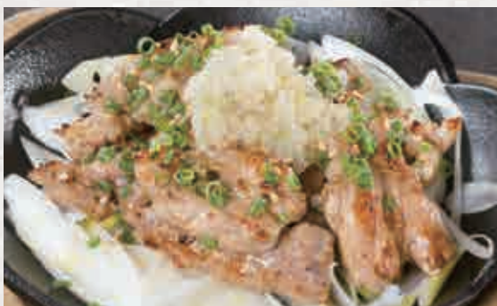
닭 목살 파 소금 철판구이 600엔