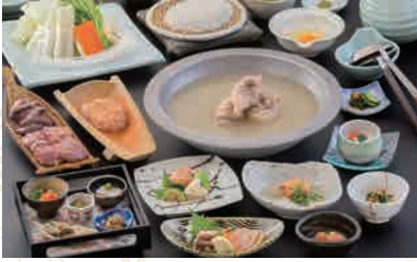
사진은 金華 (킨카) 코스 이미지입니다