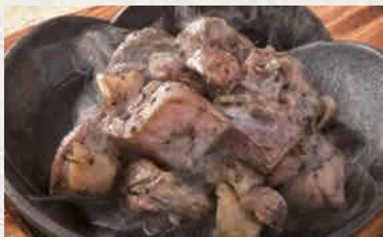
닭 다리 구이 700엔

신선한 닭다리살을 먹음직스럽게 구워올린 요리. 독특한 씹는 맛과 감칠맛을 느껴보세요.