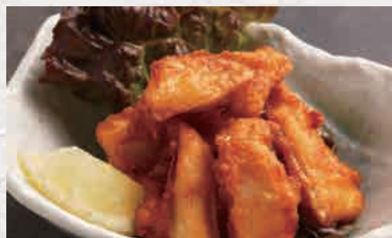
키쇼미즈키난코츠 카리아게 550엔 (희소부위 살이 붙어있는 닭연골 튀김)

희소가치가 높은 닭연골을 바삭 튀겼습니다. 닭연골의 독특한 식감과 맛을 즐겨보세요.