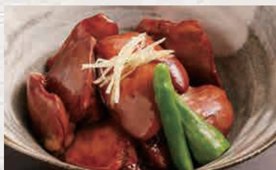
키모 칸로니 550엔