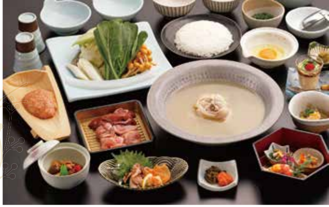
사진은 華 (하나) 코스 이미지입니다