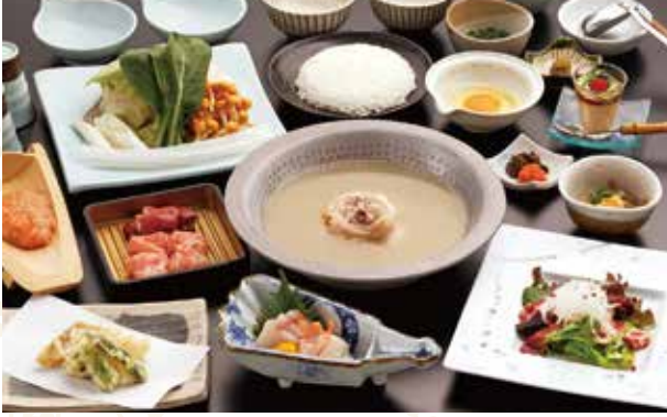
사진은 鳳凰 (호우오우) 코스 이미지입니다