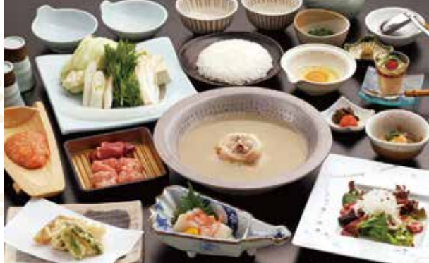
*照片顯示的是鳳凰套餐