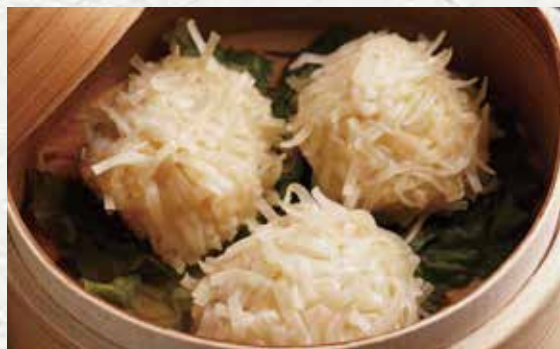
하나미도리의 두부 슈마이 580엔

미즈타키 스프에 폰즈와 유자후추를 넣은 특제 양념으로 맛을 낸 미즈타키 닭튀김.