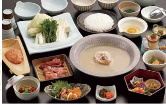
사진은 華 (하나) 코스 이미지입니다