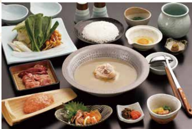
사진은 味 (아지) 코스 이미지입니다