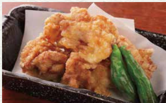
미즈타키 가라아게(백숙 튀김) 750엔

쫄깃한 식감의 연골을 바삭하게 튀겼습니다. 연골 특유의 씹는 맛과 감칠맛을 즐겨 보세요.