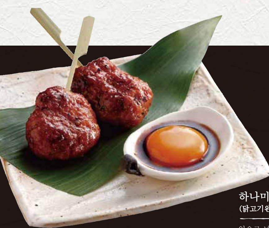
하나미도리 특제소스 츠쿠네 650엔 (닭고기완자)

입으로 넣는 순간 폭신평신했던 식감, 달걀 노른자의 단 맛이 츠쿠네의 맛을 한층 더해줍니다.