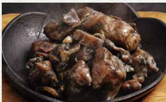
닭 숯불 구이 880엔

입으로 넣는 순간 폭신평신했던 식감, 달걀 노른자의 단 맛이 츠쿠네의 맛을 한층 더해줍니다.