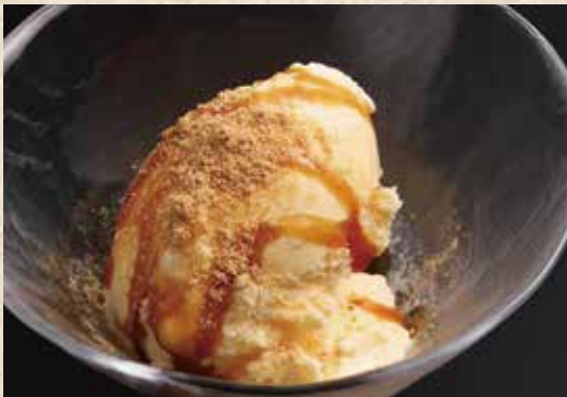
하나미 계란 아이스크림 380엔

오리지널 브랜드 하나미계란을 듬뿍 넣은 크리미한 수제 푸딩입니다. 살살 녹는 식감과 진한 맛.