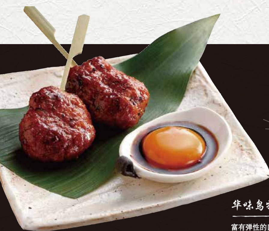
华味鸟特制酱汁鸡肉丸 650 日元