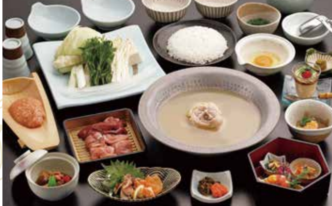
* 照片显示的是华套餐。