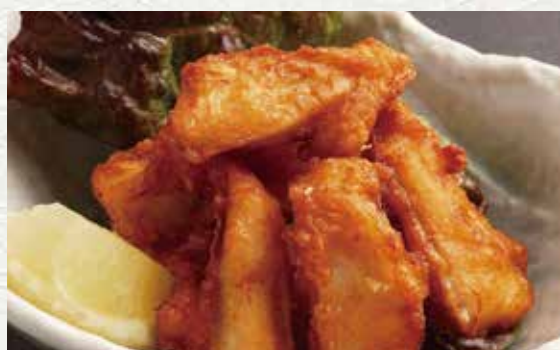
炸軟骨 650 日元