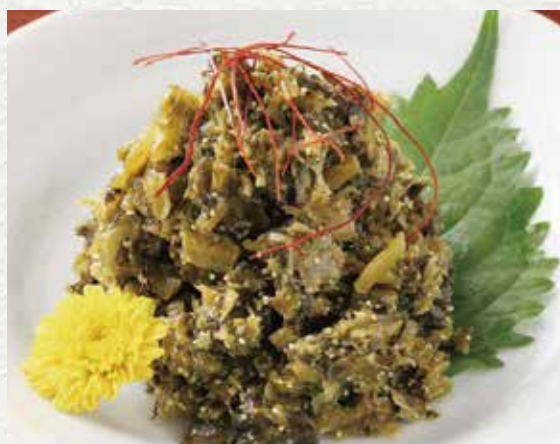
本店特制明太子鱼子酱高菜 450 日元