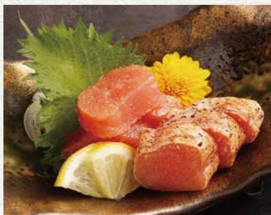
本店特制明太子鱼子酱 950 日元

将优质的原卵腌渍在融合日本国产昆布与鲣鱼鲜味的特制酱汁中。微辣之中带有柔和细腻的风味。以生食与炙烤拼盘呈现。