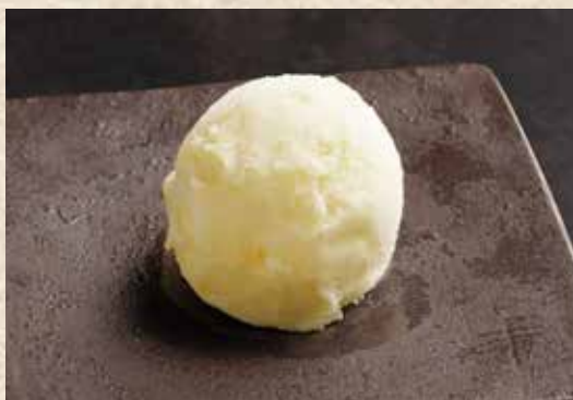
柚子冻冰沙(加有果肉) 380 日元