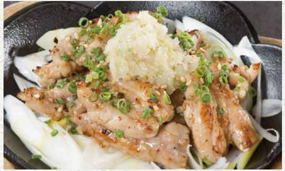
닭 목살 파 소금 철판구이 880엔

입에 닿는 느낌이 좋고 살이 부드럽게 만들어진 닭가슴살을 특제 다시간장과 짙은 풍미의 와사비로 드셔보시기 바랍니다. 곁들여 나오는 노자와나즈케(순무잎절임)가 맛의 악센트를 줍니다.