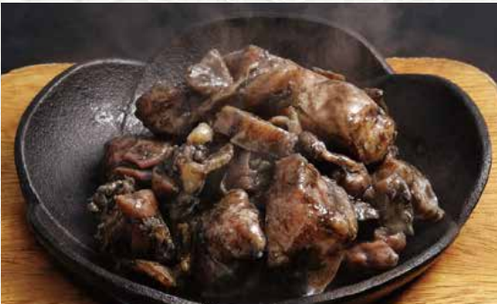
닭다리 아부리 구이 980엔

국산 닭을 강한 불맛으로 구워냈습니다. 독특한 씹는 맛과 고기의 맛 성분을 즐겨 보세요