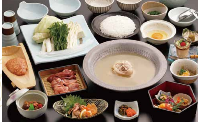
사진은 華(하나) 코스 이미지입니다