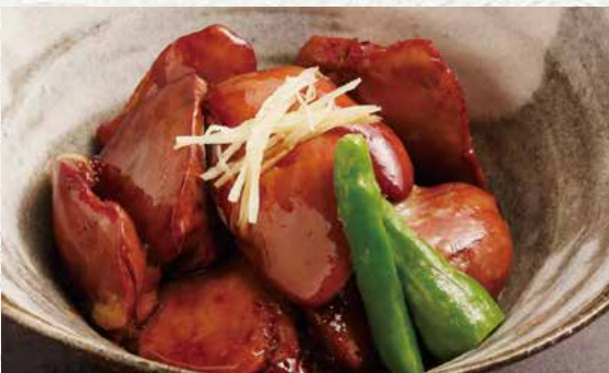
키모 칸로니 750엔