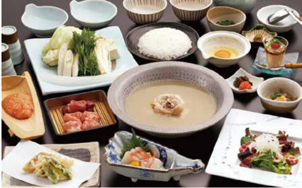
사진은 鳳凰(호우오우) 코스 이미지입니다