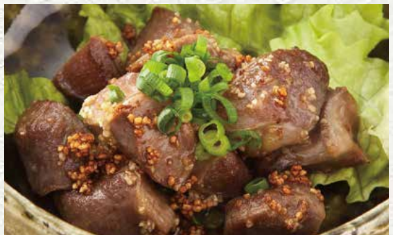
스나즈리 갈릭이라메 750엔 (닭통집 마늘볶음)

국산 닭을 강한 불맛으로 구워냈습니다. 독특한 씹는 맛과 고기의 맛 성분을 즐겨 보세요