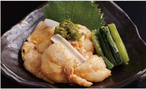
하나미도리 사사미토리와사 580엔 (닭가슴살 와사비)

입에 닿는 느낌이 좋고 살이 부드럽게 만들어진 닭가슴살을 특제 다시간장과 짙은 풍미의 와사비로 드셔보시기 바랍니다. 곁들여 나오는 노자와나즈케(순무잎절임)가 맛의 악센트를 줍니다.