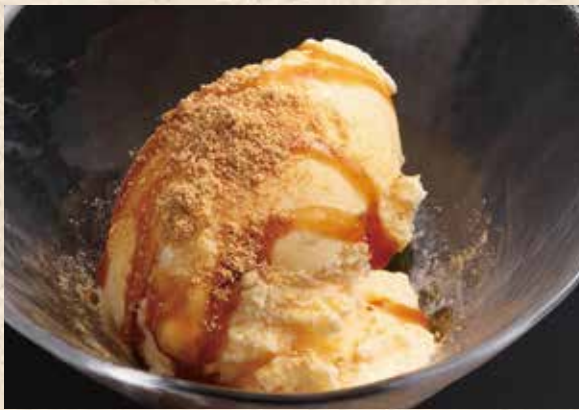
하나미 계란 아이스크림

오리지널 브랜드 하나미계란을 듬뿍 넣은 크림미한 수제 푸딩입니다. 살살 녹는 식감과 진한 맛.