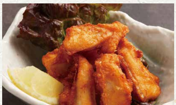
연골 튀김 750엔

쫄깃한 식감의 연골을 바삭하게 튀겼습니다. 연골 특유의 씹는 맛과 감칠맛을 즐겨 보세요.