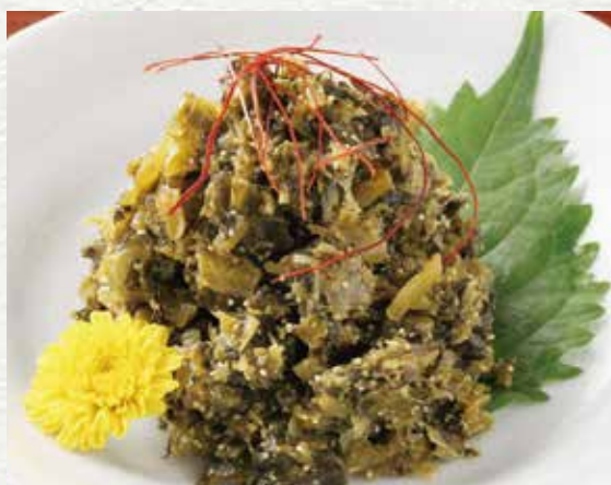
本店特制明太子鱼子酱高菜 430 日元