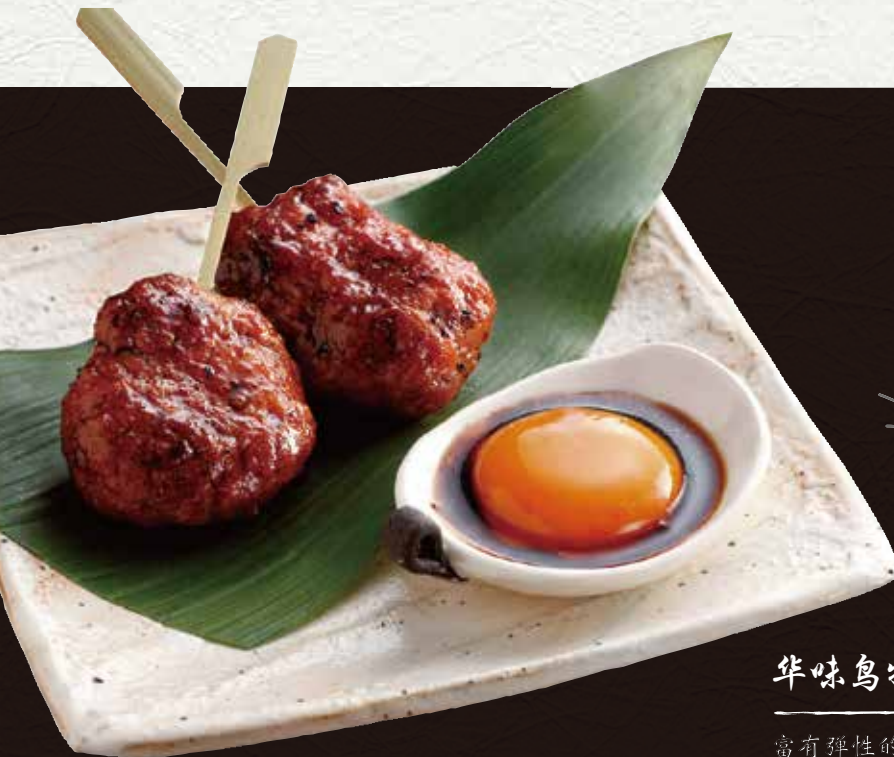
华味鸟特制酱汁鸡肉丸 600日元