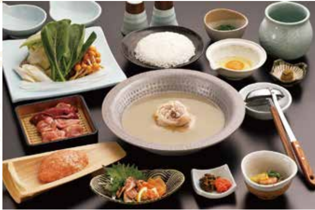
* 照片显示的是味套餐。